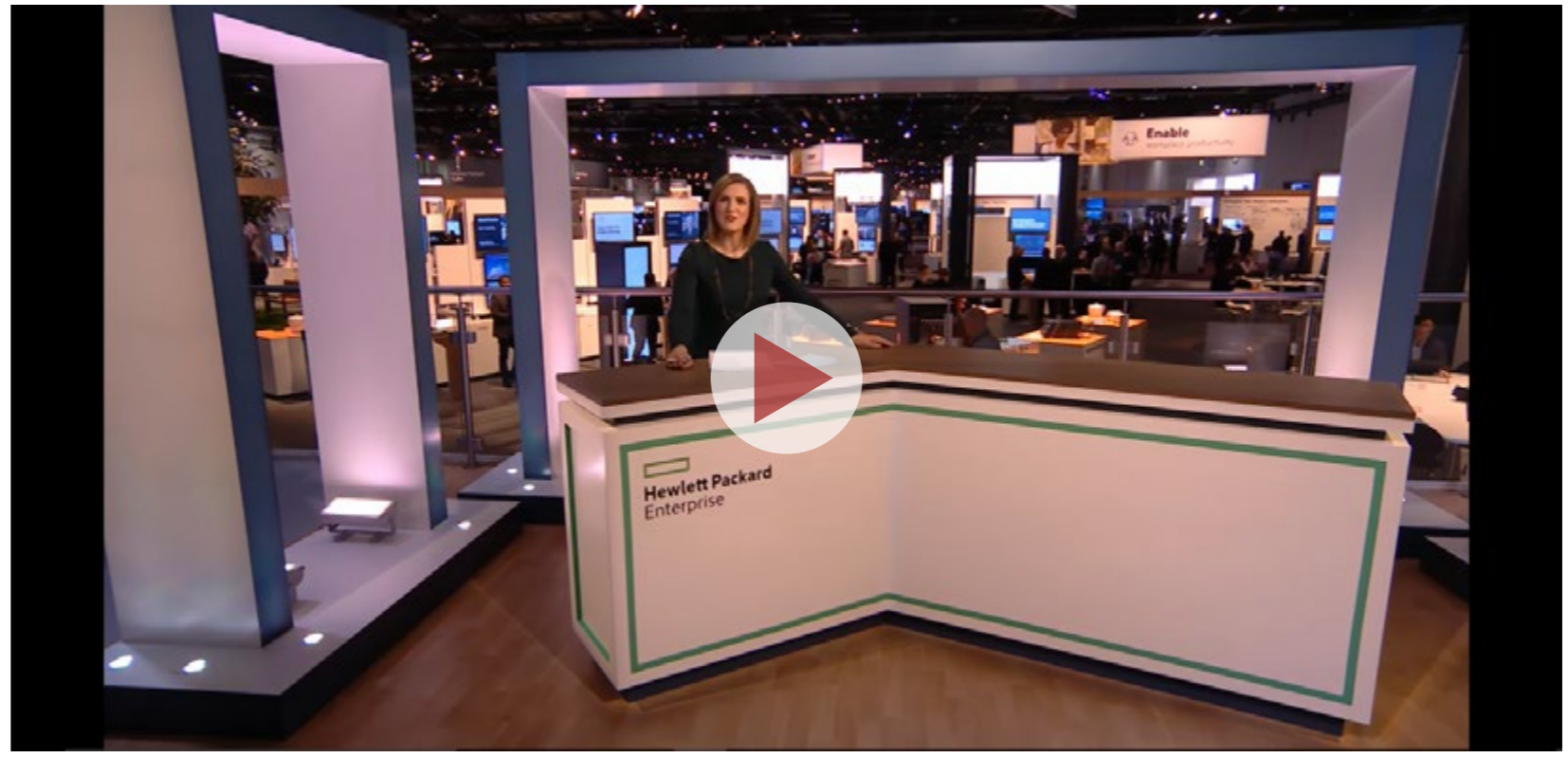
Sesión Día 1 Discover 2016

sas una plataforma de nube híbrida de Azure en sus propios centros de datos que, además, es compatible con los servicios en nubes privadas de Azure. Se desarrollará basándose en el servidor HPE ProLiant DL380, como un sistema completo informático y de almacenamiento, red y software. Con el uso de un por-