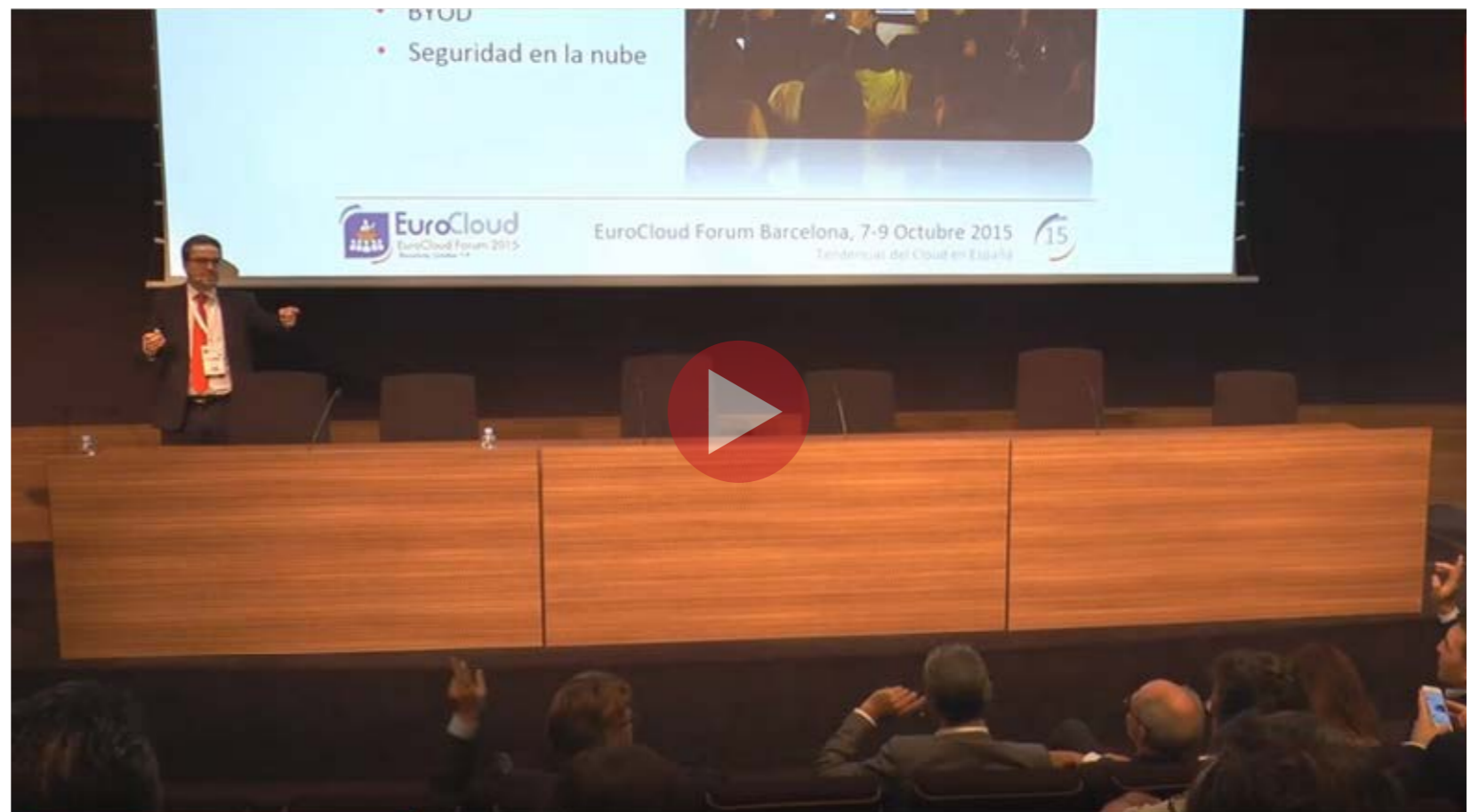
Entrevistas con los principales portavoces de EuroCloud y la industria cloud