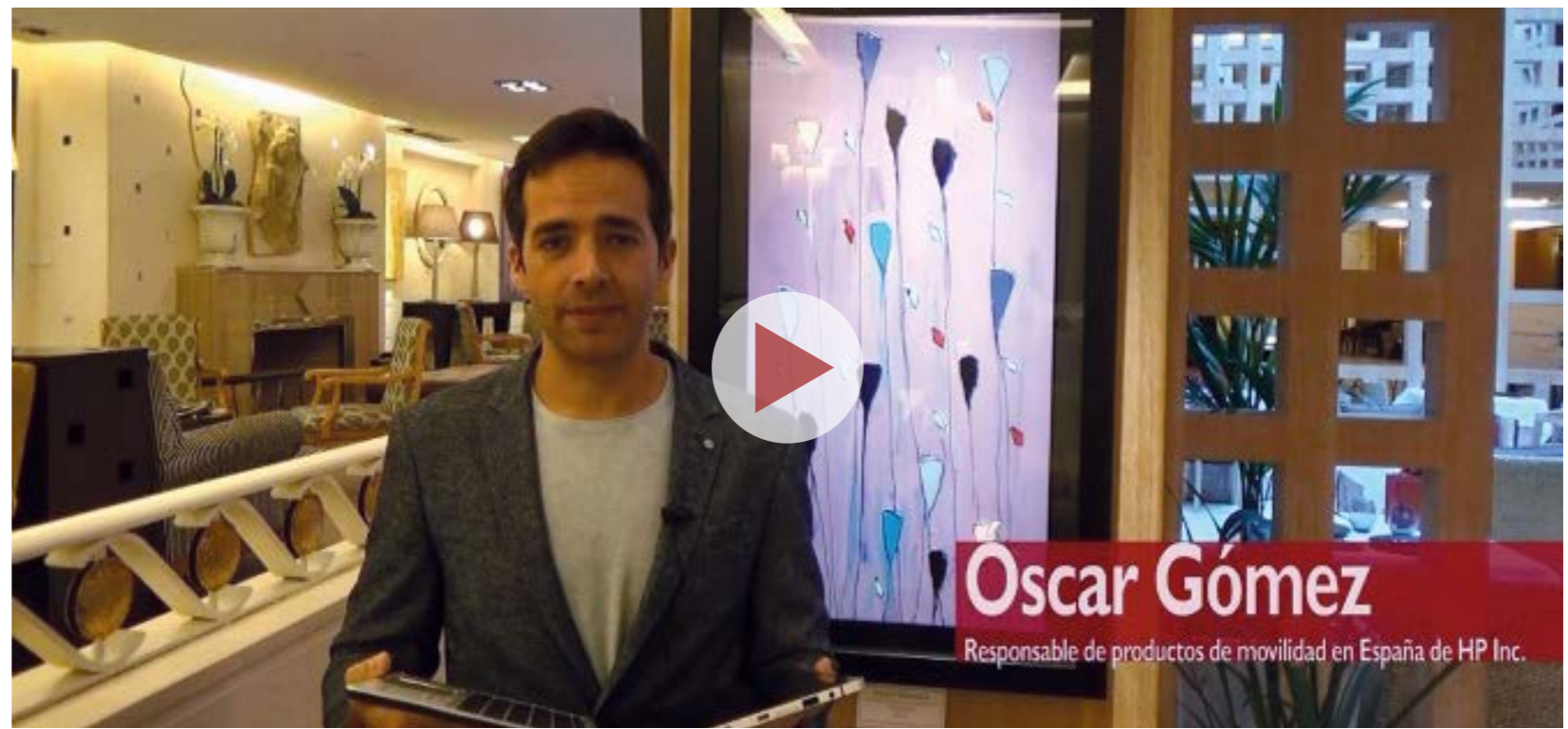
Elite x2 1012: El nuevo 2 en 1 para la empresa

Conscientes de que se trata de la categoría móvil que más crece y mejores perspectivas presenta para los próximos años, HP ha querido dar un paso más allá en la evolución del 2 en 1 con el nuevo Elite X2 1012. Pensado para el usuario profesional, tal y como señala Óscar Gómez, responsable de dispositivos móviles profesionales de HP Inc. España, “aúna los deseos de los usuarios y de los departamentos de TI”. El nuevo