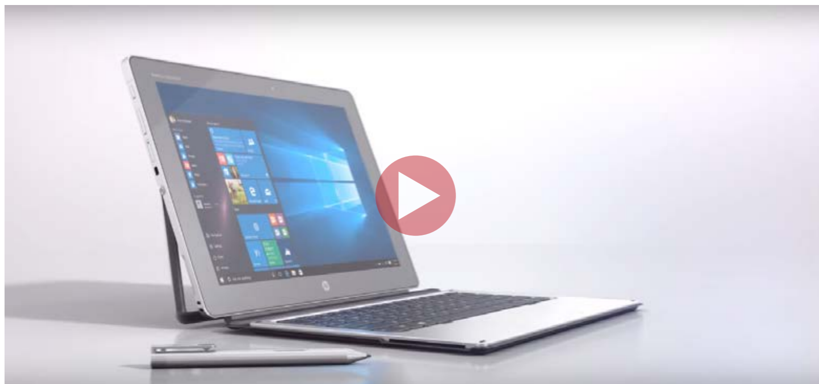
HP Elite x2 1012