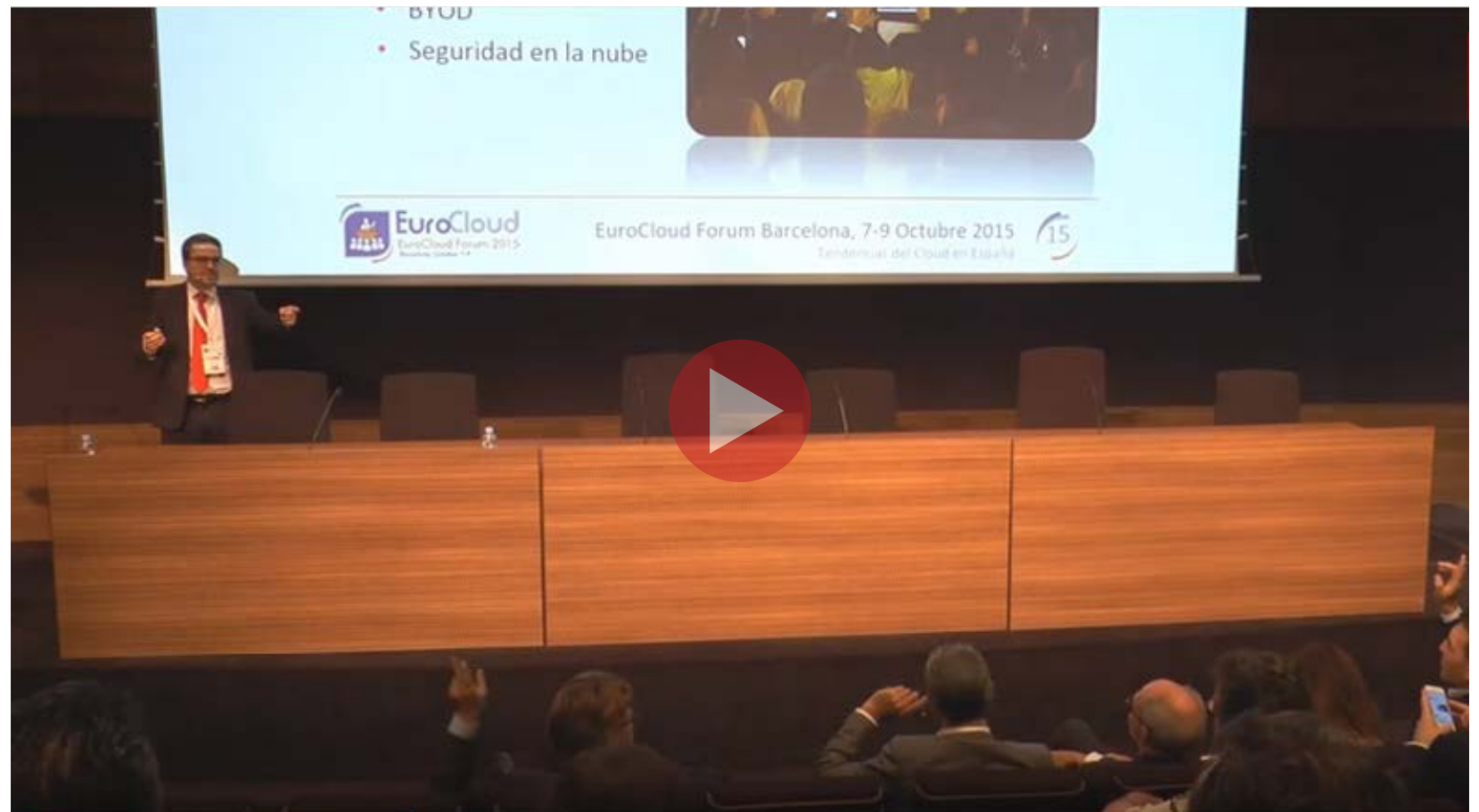
Entrevistas con los principales portavoces de EuroCloud y la industria cloud