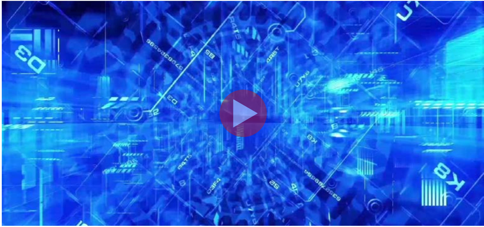
La Transformación Digital