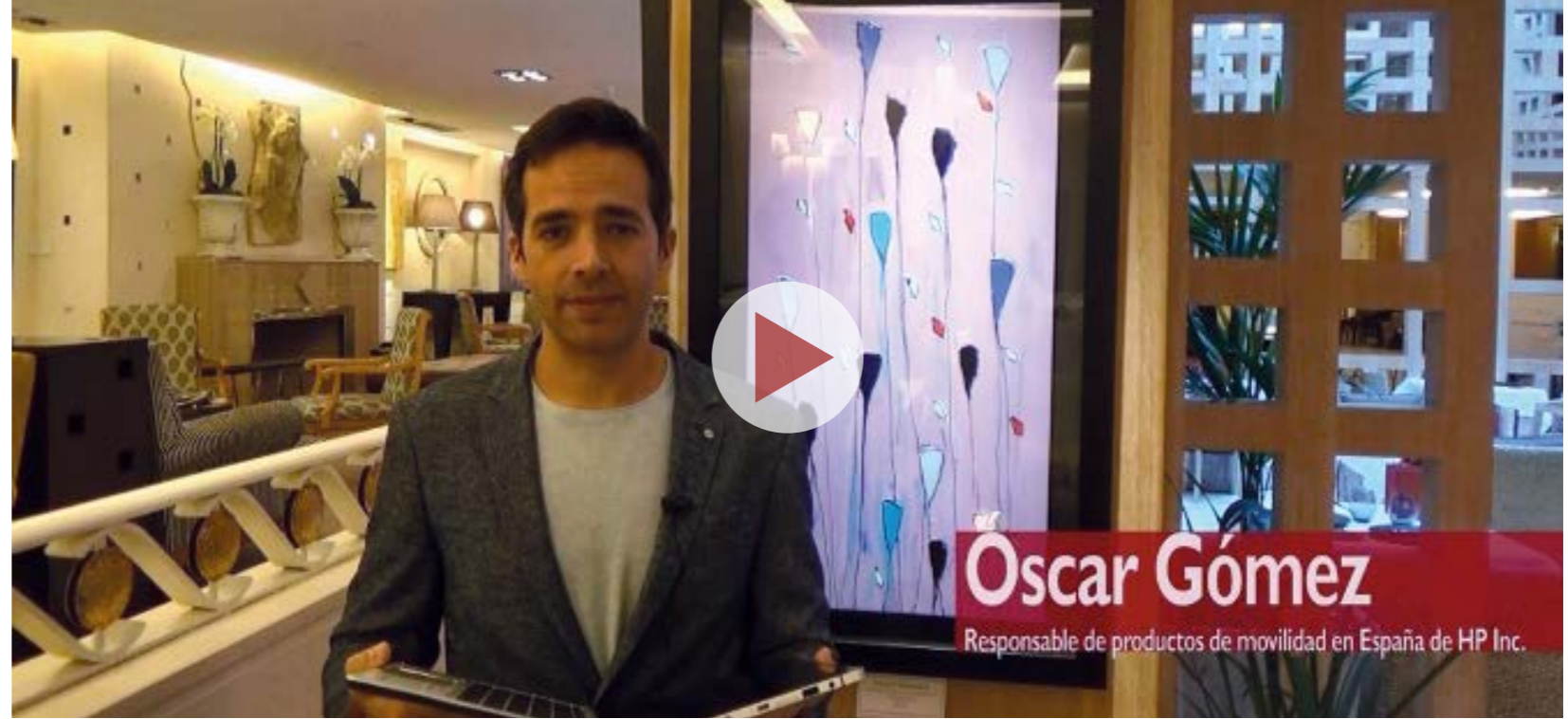
Elite x2 1012: El nuevo 2 en 1 para la empresa